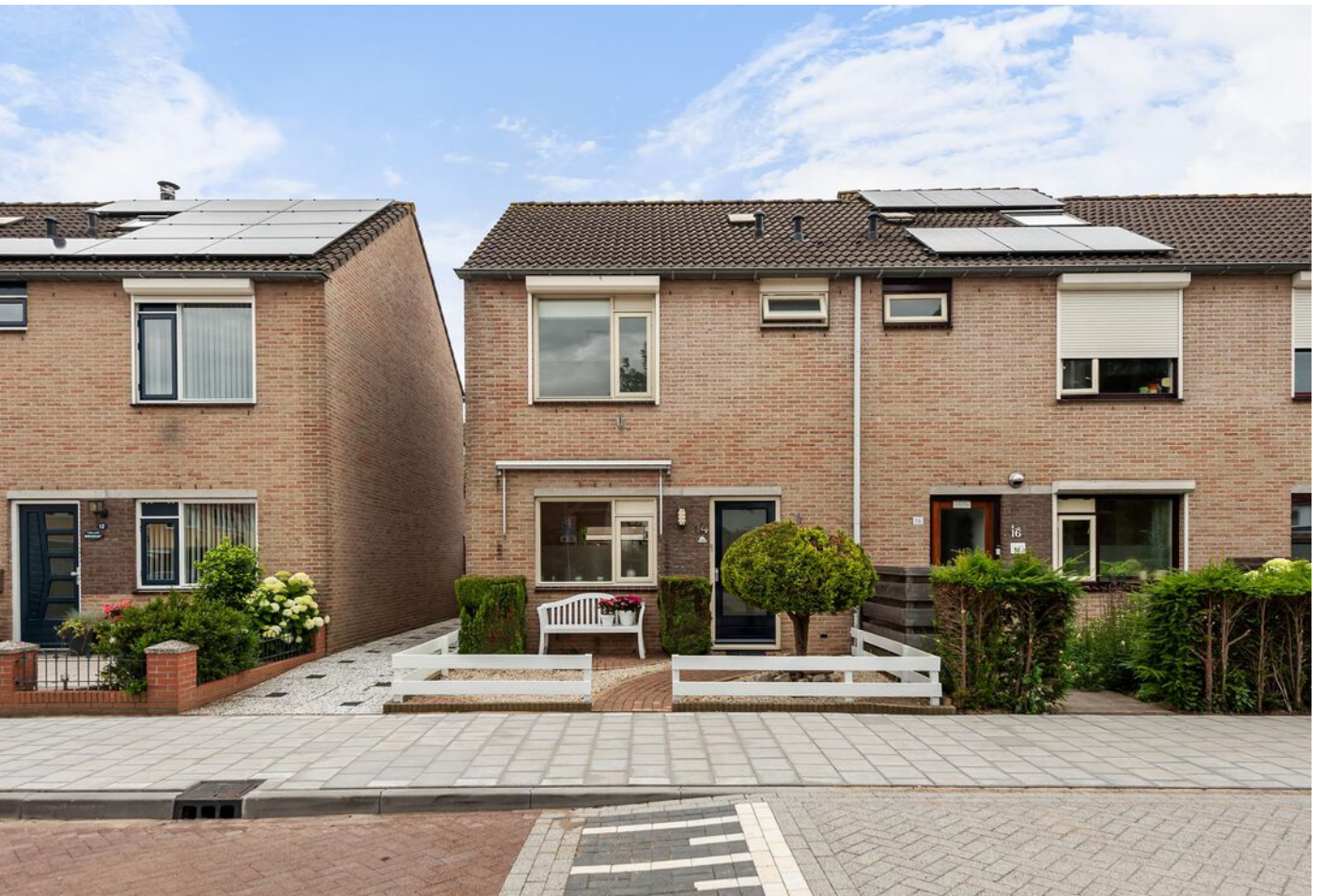
Leeuwerikstraat 14, Vianen