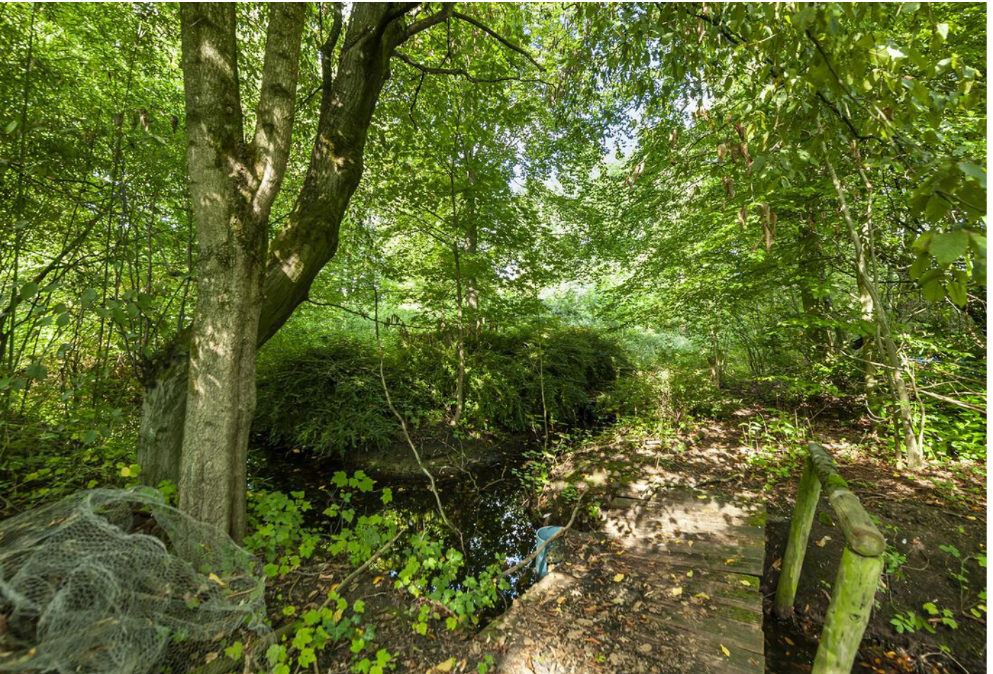
Europaweg 4, Vleuten